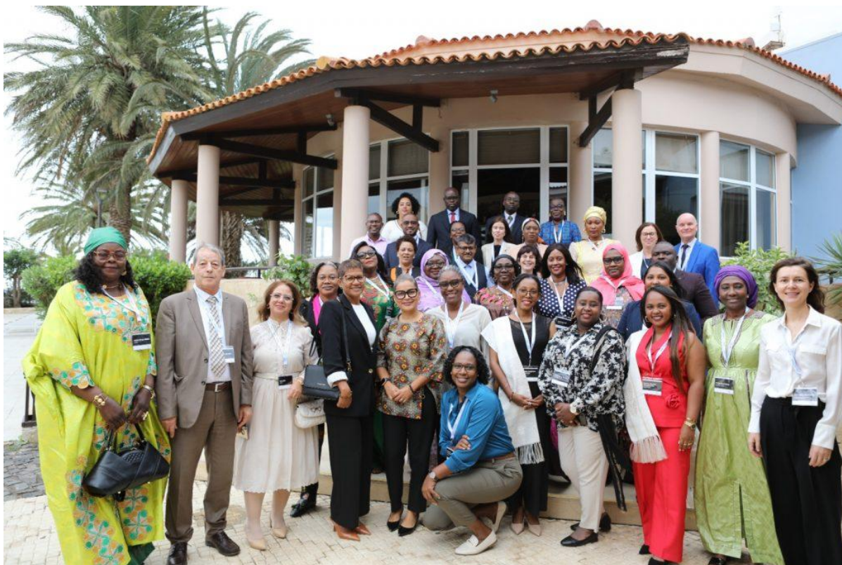
Les personnes participantes à la formation

Les participantes et participants ont assisté à trois jours complets de formation pour en savoir davantage sur les concepts et sur les outils liés à l'intégration du genre dans un organisme public, notamment dans le cycle de planification, de suivi et d'évaluation d'un programme ou d'un projet. La formation a aussi présenté les mécanismes qui permettent aux OGE d'intégrer ces notions dans leur planification et dans leurs activités tout au long du cycle électoral.