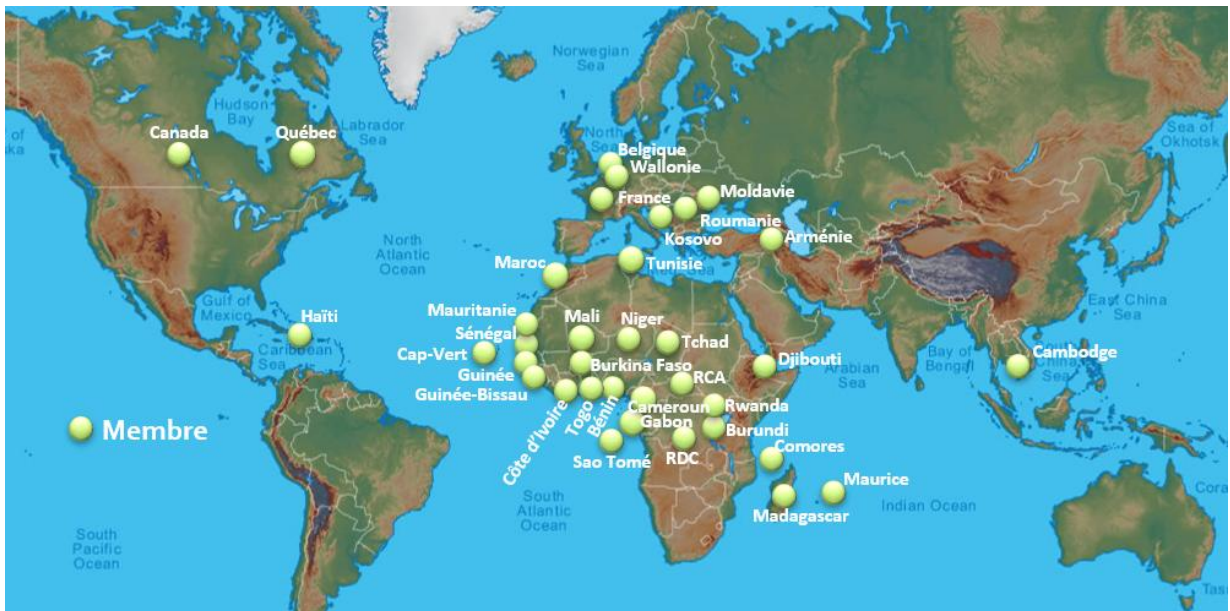
Répartition des 37 institutions membres du RECEF au 31 décembre 2025

Le RECEF a également admis un nouveau membre : la Cellule Élections et Participation du ministère de l'Intérieur de la Wallonie, un État fédéré de la Belgique membre de l'OIF. Il s'agit du 37 e membre du réseau.