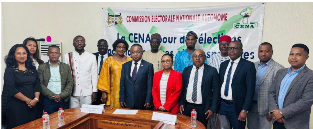
La CENI de Madagascar visite la CENA du Bénin

La deuxième activité bilatérale a été réalisée du 4 au 8 août 2025 entre la Commission électorale nationale indépendante (CENI) de Madagascar et la Commission électorale nationale autonome (CENA) du Bénin. La délégation malgache a réalisé cette mission afin d'étudier la gestion du fichier électoral biométrique du Bénin, dans un contexte où Madagascar souhaite migrer d'un fichier électoral alphanumérique à un fichier électoral biométrique.