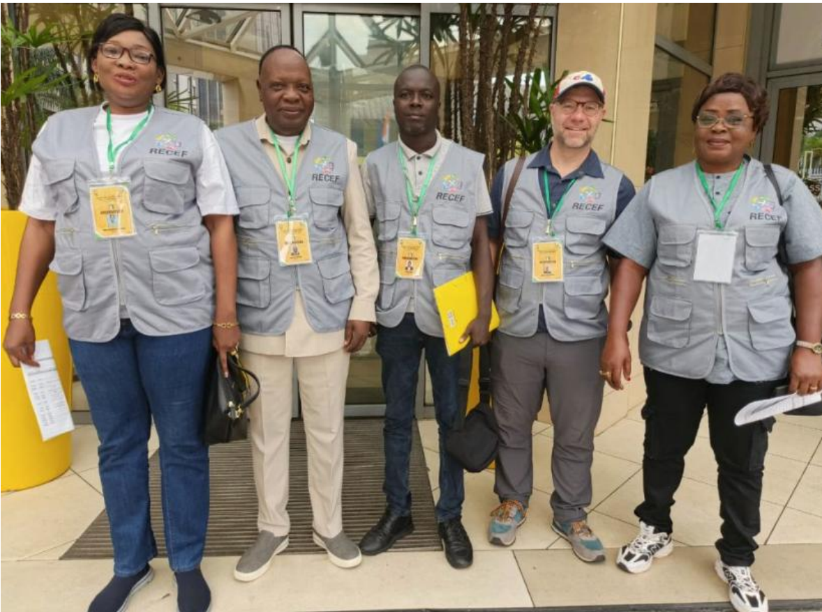
Les membres de la délégation du RECEF

Du 22 au 24 octobre, les membres de la délégation ont participé à des rencontres préparatoires afin de connaître le système électoral ivoirien et les enjeux de cette élection. Le jour de l'élection, le 25 octobre, les membres de la délégation du RECEF ont observé les opérations électorales dans quelques bureaux de vote, notamment lors de l'ouverture et de la fermeture des bureaux. En soirée, ils ont également observé les opérations de dépouillement des votes.