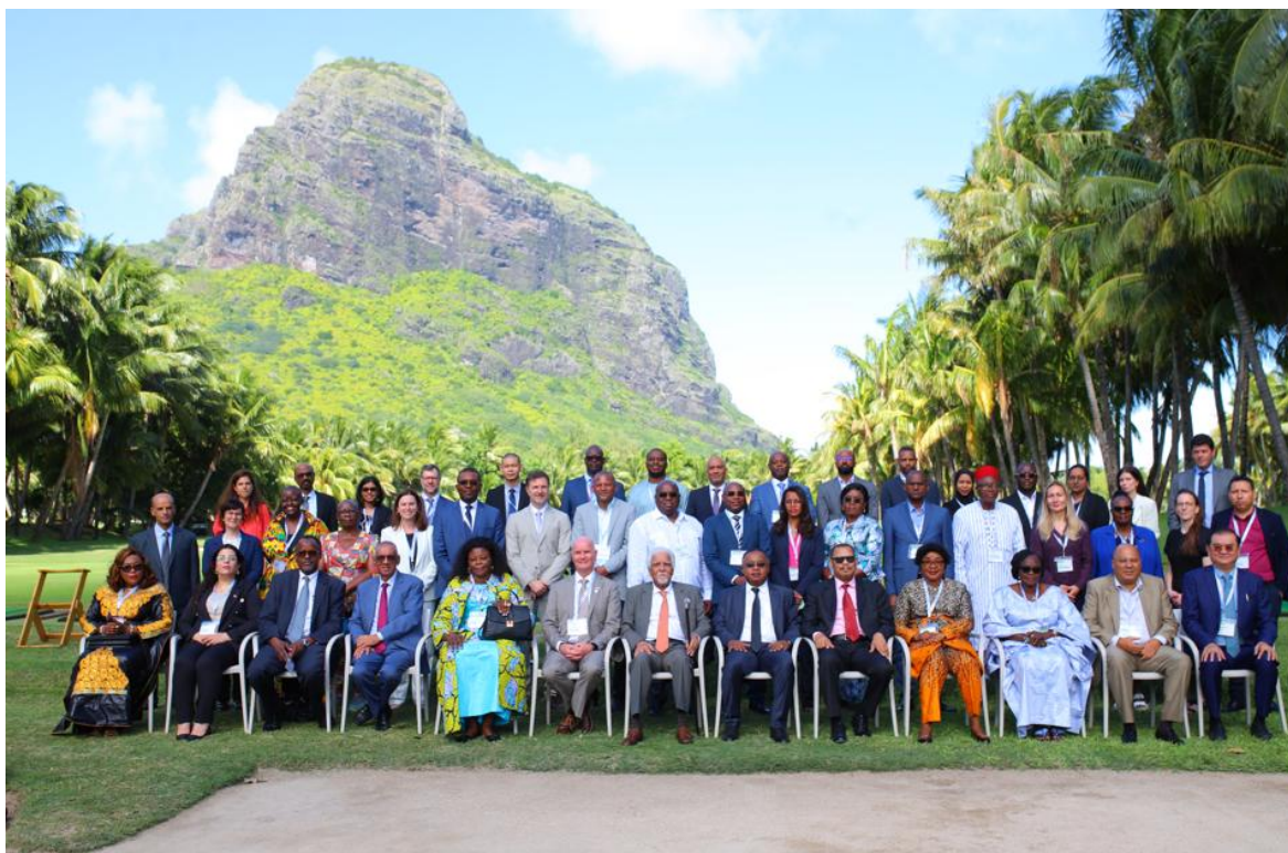
Participantes et participants

L'événement a rassemblé quelque 50 personnes provenant de 20 organismes de gestion des élections (OGE) de l'espace francophone ainsi que de plusieurs partenaires internationaux, dont l'OIF, International IDEA, le Centre européen d'appui électoral (ECES), la Commission de l'océan Indien (COI), le Réseau des organismes de gestion des élections de l'Afrique de l'Ouest (RESAO), l'Union africaine et Affaires mondiales Canada. Parmi les représentantes et représentants des OGE du RECEF, 44 % étaient de femmes.