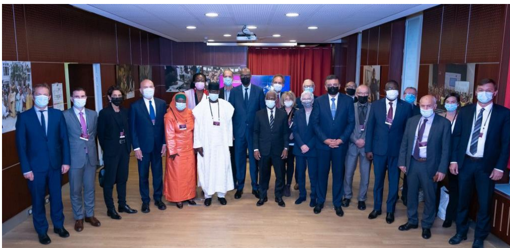
Photographie de famille des personnes présentes au siège social de l'OIF à Paris.

Lors de l'atelier portant sur le partenariat entre l'OIF et les réseaux institutionnels, les discussions ont porté sur les réformes actuelles de la Francophonie menées par le leadership de sa secrétaire générale, S. E. M me Louise Mushikiwabo, et sur le projet d'une relation renouvelée avec les réseaux institutionnels. Les personnes présentes ont convenu d'approfondir la relation entre l'OIF et les réseaux institutionnels; de développer des programmations conjointes; et de mettre en œuvre des projets concrets. L'OIF s'appuie sur quelque 600 institutions nationales œuvrant à l'État de droit et à la bonne gouvernance démocratique.