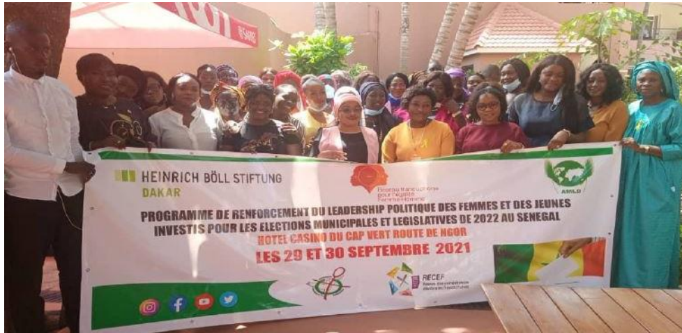
Photographie de famille des personnes participantes