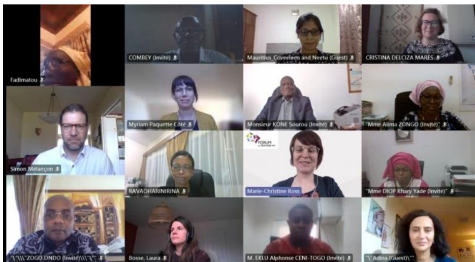
Quelques personnes participantes à l'atelier du Forum des femmes

Avec près de 50 personnes participantes représentant 14 OGE et 4 organisations internationales, cet événement virtuel fut un grand succès. Le dynamisme des discussions démontre l'intérêt notable pour les questions d'égalité chez les OGE du RECEF et leur désir de poursuivre la conversation dans les prochaines activités du RECEF, dont le Forum des femmes. Un rapport synthèse a été diffusé à la suite de cet événement.