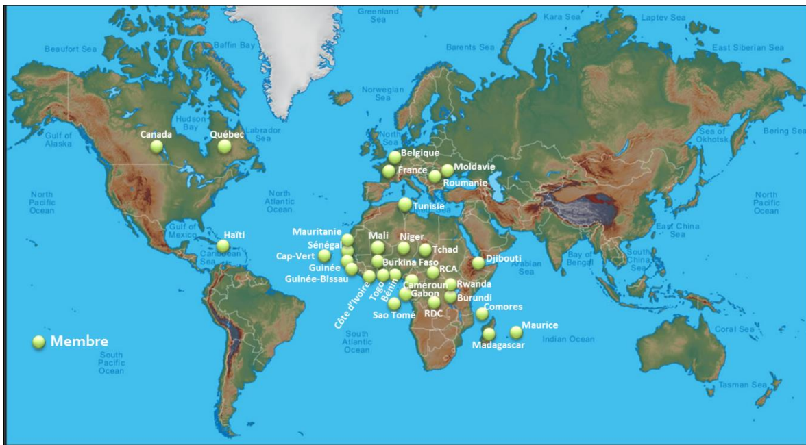
Répartition des 32 institutions membres du RECEF au 31 décembre 2020

Le 5 novembre 2020, le RECEF a tenu sa 8 e Assemblée générale annuelle par visioconférence. Cet événement a rassemblé 28 représentantes et représentants de 16 organismes de gestion des élections (OGE) de l'espace francophone, en présence de représentants de l'Organisation internationale de la Francophonie (OIF). Les OGE des États et gouvernements représentés étaient les suivants : Bénin, Burundi, Canada, Comores, Djibouti, France, Guinée-Bissau, Madagascar, Mali, Mauritanie, Québec, Roumanie, Sao Tomé-et-Principe, Sénégal, Togo et Tunisie. Le RECEF compte 32 OGE membres.