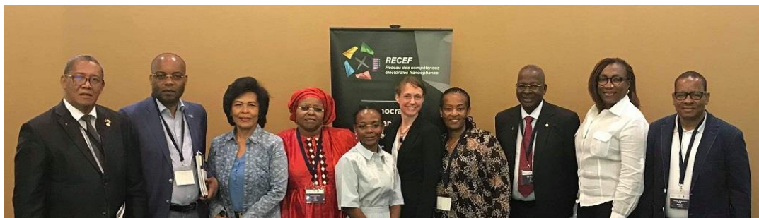
Les administrateurs du Bureau et les membres du Cercle de coordination du Forum des femmes