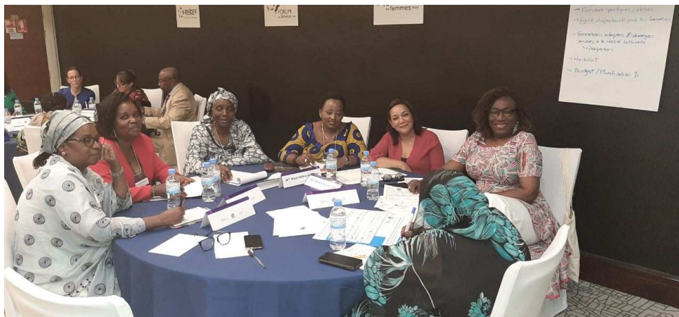
Les travaux en petits groupes