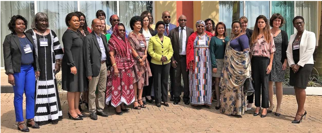
Les participantes et les participants accompagnés de la ministre du Genre et de la Protection de la famille du Rwanda

Le présent rapport d'activité présente les principaux échanges réalisés lors des ateliers ainsi que leur évaluation par les participantes et les participants. Il énonce aussi les conclusions