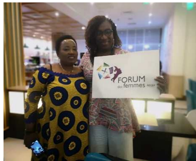
Les représentantes du RECEF dévoilent le résultat du vote