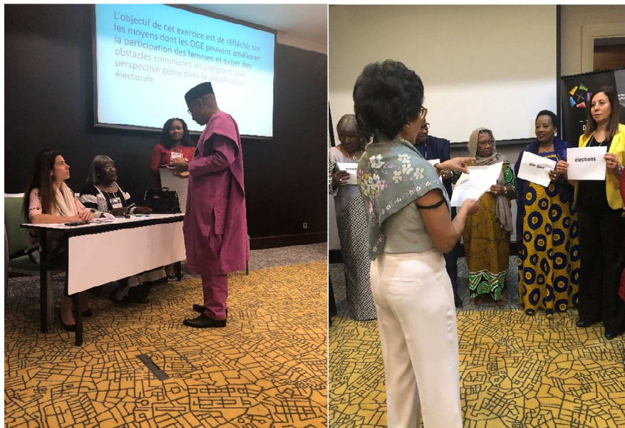
Des activités brise-glace