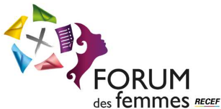
Le logo du Forum des femmes du RECEF