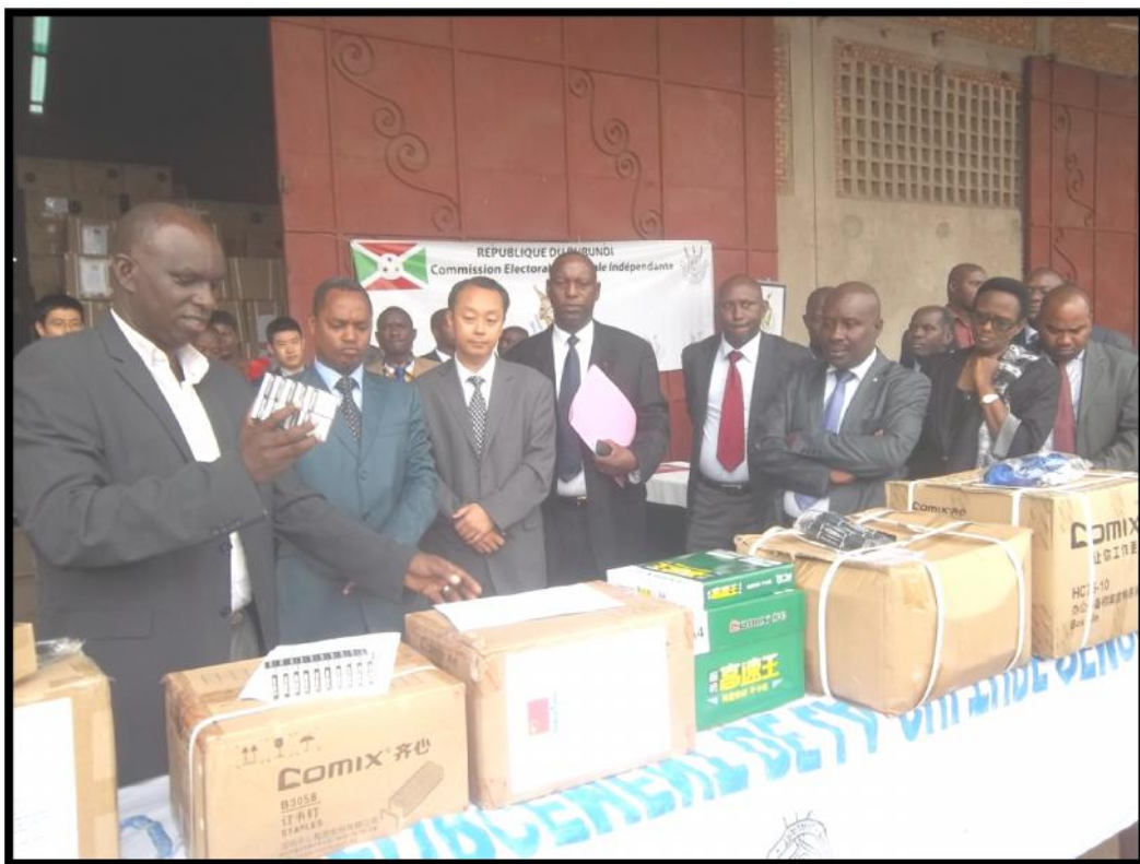
Cérémonie de réception du don du matériel électoral offert par la République Populaire de Chine à la CENI