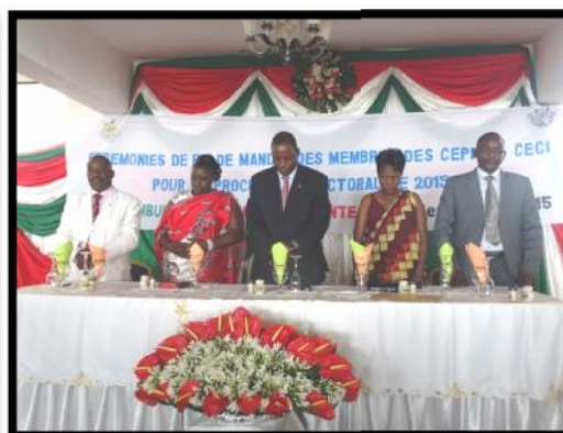
Les Membres du Bureau après le 1 er juin 2015