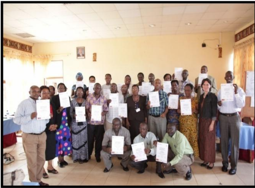
Photo de famille des participants à la formation BRIDGE sur le genre et les élections

Le succès d'un processus électoral résulte notamment de la capacité professionnelle et technique de l'OGE. C'est dans ce contexte que des formations ont été organisées pour les Membres de la CENI et son personnel. Parfois, des représentants des partenaires y ont été associés.