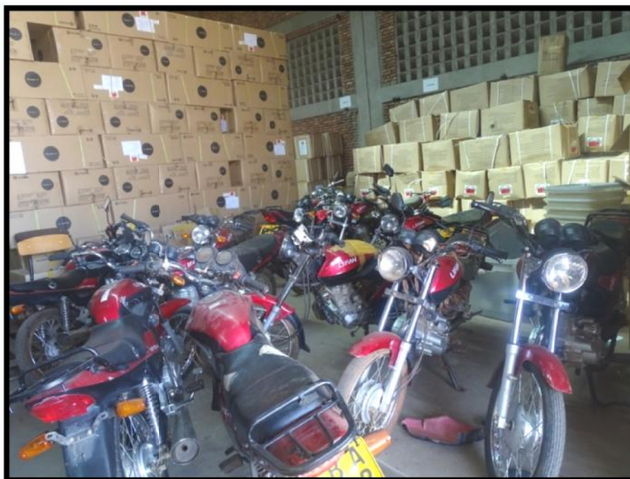
Des motos et du matériel électoral de la CENI dans son entrepôt

Deux entrepôts contenaient le matériel resté en 2010. Un troisième a été temporairement loué pour les besoins d'entreposage du matériel électoral commandé.