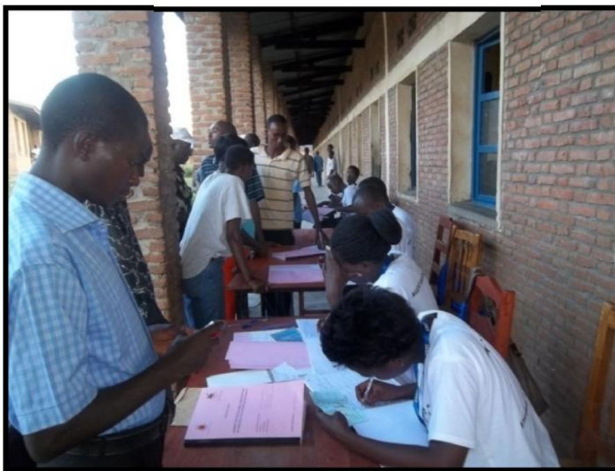
Les agents d'inscription recueillent les données de la population en âge de voter

Pour la collecte de ces informations, quatorze mille quatre cent soixante neuf (14 469) registres d'inscription et autant de carnets d'attestations d'inscription ont été utilisés.