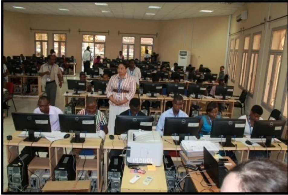
Les agents du CTD saisissent les données de l'enrôlement des électeurs

A l'aide du logiciel « Système Intégré de Gestion des Elections » (SIGELE), la saisie a été effectuée par 1012 agents de saisie supervisés directement par 70 chefs d'équipe de saisie. Ces agents opéraient en trois vacations de six heures chacune.