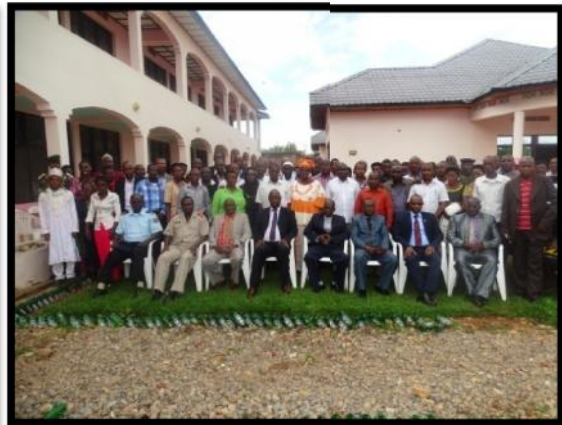
Rutana-Photo des participants à l'atelier régional d'évaluation du processus électoral 2015

A l'issue de ces réunions d'évaluation, des leçons ont été dégagées et des recommandations formulées dans différents domaines en vue d'améliorer les processus électoraux futurs.