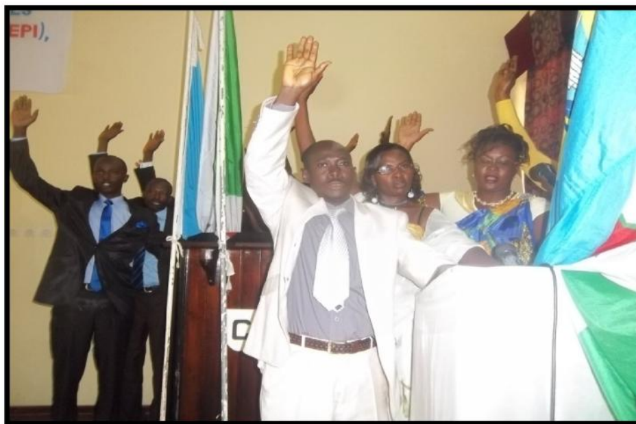
Cérémonie de prestation de serment des Membres des CEPI

Ils sont au nombre de 165 au niveau national. Lors de leur entrée en fonction, ils prêtent serment solennellement devant le Bureau de la CENI pour un mandat d'une année.