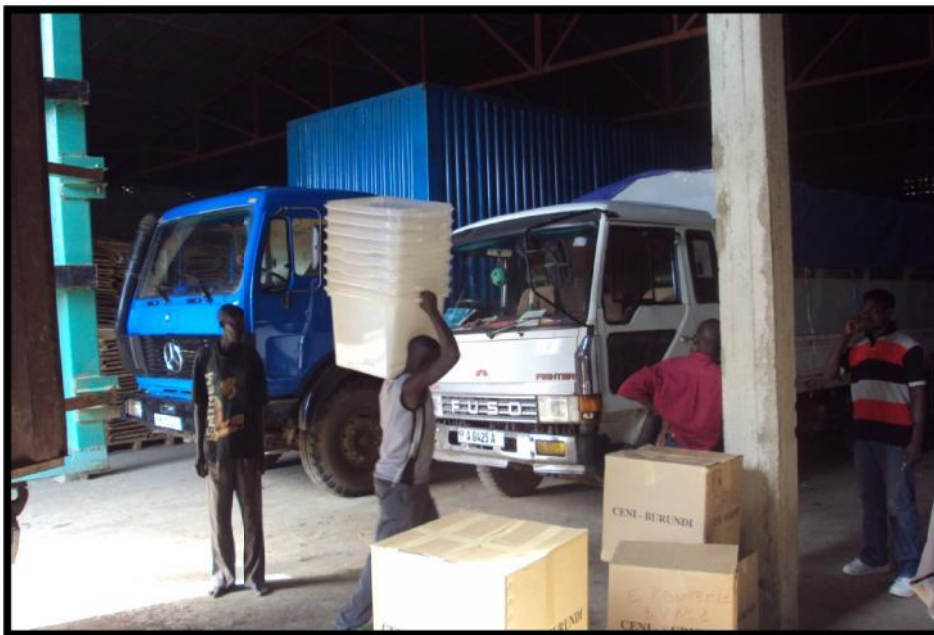
Retour du matériel électoral dans les entrepôts de la CENI

Pour le retour du matériel électoral, un plan de rapatriement a été conçu et exécuté à la fin de tous les scrutins de 2015. Ce matériel est actuellement stocké dans les deux entrepôts de la CENI. Le détail de ce matériel est repris dans le tableau ci-dessous.