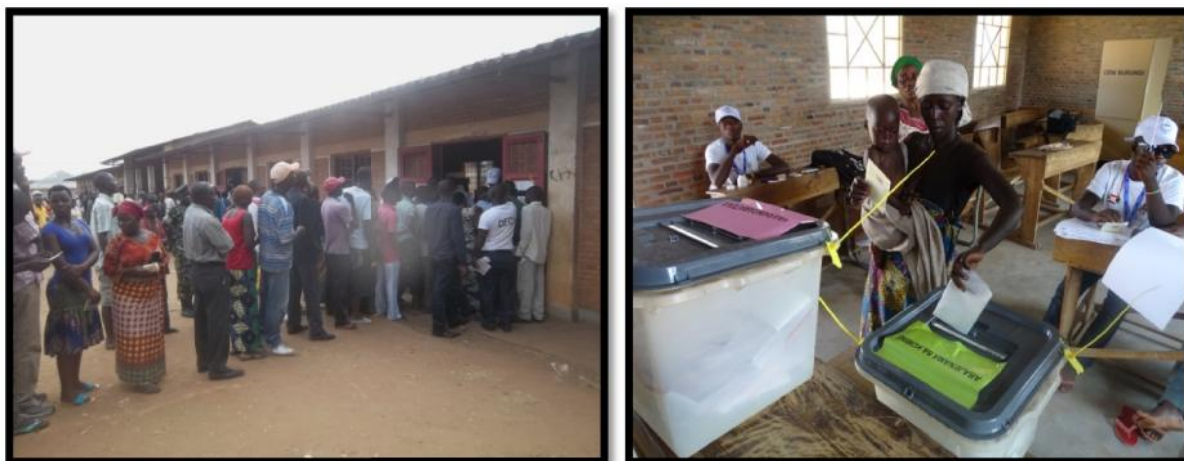
Images de l'élection des Conseillers communaux et des Députés

Malgré les rumeurs d'insécurité et les appels de certains partenaires électoraux pour le boycott du vote, la population éléctrice a répondu nombreuse aux scrutins combinés du 29 juin 2015.