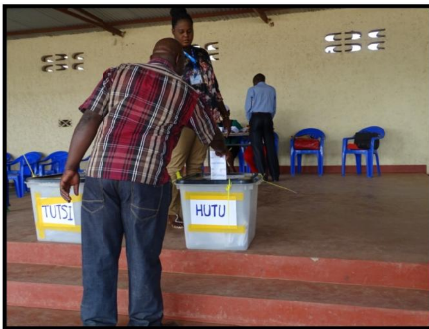
Un Conseiller communal en train de voter pour les Sénateurs

L'élection des Sénateurs a eu lieu en date du 24 juillet 2015 au chef-lieu de chaque province avec comme électeurs le collège des Conseillers communaux élus dans la circonscription. Le jour du scrutin, les Conseillers communaux se présentent un à un au B.V et chacun reçoit deux bulletins de vote représentant les deux listes, un pour l'ethnie Hutu et un autre pour l'ethnie Tutsi.