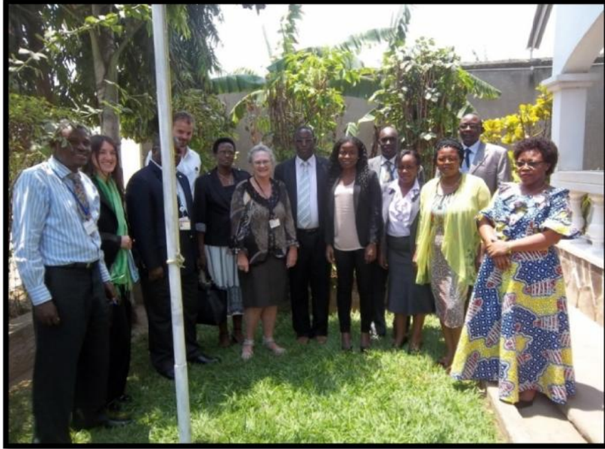
Une délégation de la NAM venue de New York reçue par la CENI

L'évaluation de l'état des décaissements se faisait à travers des réunions du Comité de pilotage du PACE 2015. Beaucoup d'hésitations à financer les activités de la CENI ont été observées et des conditionnalités étaient exigées pour le décaissement des fonds. En plein processus électoral, certains PTFs ont malheureusement suspendu les financements annoncés.