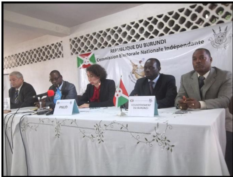
Séance de signature des conventions de financement du processus électoral 2015 : de gauche à droite l'Ambassadeur de Belgique, le Président de la CENI, la Directrice pays du PNUD, le Secrétaire permanent au Ministère des Relations Extérieures et de la Coopération Internationale et le Ministre de l'Intérieur

C'est dans ce cadre que le PNUD a contribué à la mobilisation des fonds pour le Basket fund qu'il a géré au nom des PTFs.