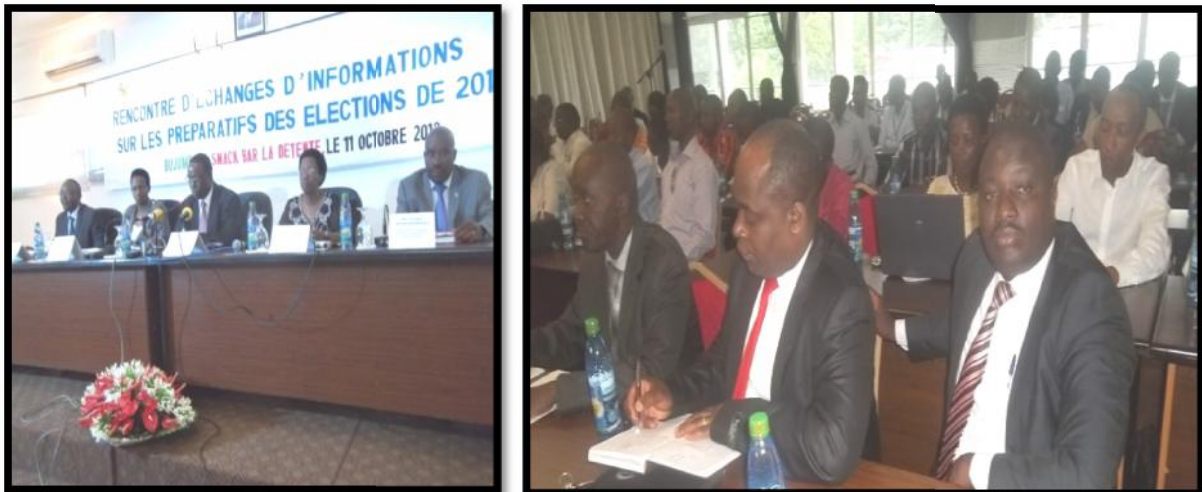
Réunion d'échanges entre la CENI et les OSCs sur le cadre et les modalités de collaboration

Entant qu'Organisme de Gestion des Elections (OGE), l'éducation civique et électorale incombe principalement à la CENI. Mais, au vu de sa complexité et des enjeux électoraux, d'autres acteurs électoraux peuvent l'épauler. C'est dans cette optique que la CENI a identifié les organisations de la Société civile capables de contribuer en cette matière. Sur 127 OSCs qui ont exprimé la volonté d'accompagner la CENI, 89 ont été retenues.