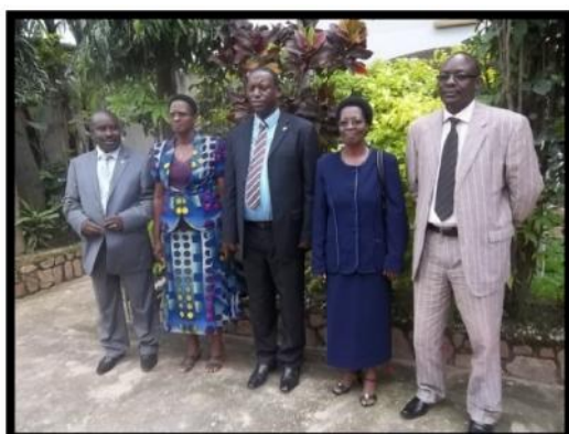
Les Membres du Bureau avant le 1 er juin 2015

Approuvés séparément par les deux chambres du Parlement, les cinq (5) Membres du Bureau de la CENI ont été nommés par Décret n° 100/319 du 5 décembre 2012. Après la démission de deux Membres de la CENI au mois de juin 2015, leur remplacement a été effectué par Décret n° 100/191 du 13 juin 2015.