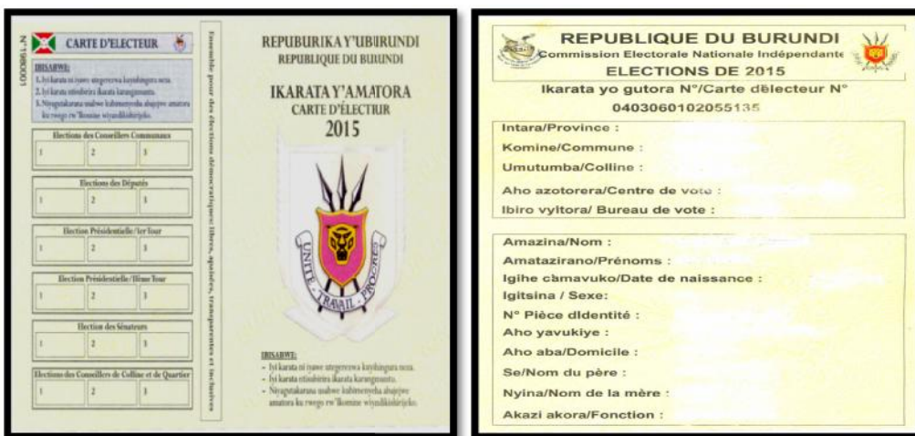
Recto de la carte d'électeur 2015

La photo ci-dessous montre le modèle de la carte d'électeur de 2015.