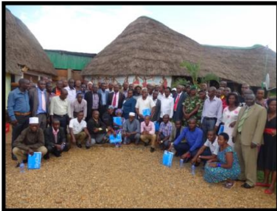
Cibitoke-Photo des participants à l'atelier régional d'évaluation du processus électoral 2015

Au cours de la phase postélectorale, la CENI a procédé à l'évaluation du processus électoral de 2015. A cet effet, un atelier national et quatre ateliers régionaux ont été organisés et tenus à travers tout le pays. Ces ateliers ont vu la participation des représentants des partis politiques, des OSCs, des confessions religieuses, de l'administration territoriale, des Corps de défense et de sécurité, des médias, de la CENI et de ses démembrements, de la justice, des Institutions, etc.