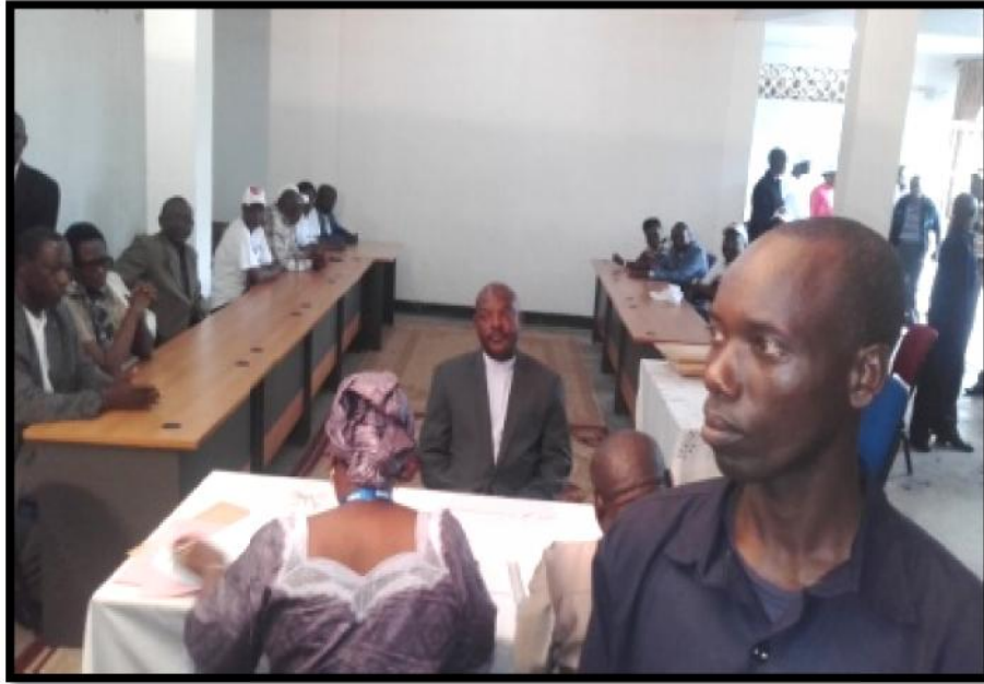
Le candidat Pierre NKURUNZIZA du CNDD-FDD dépose son dossier de candidature