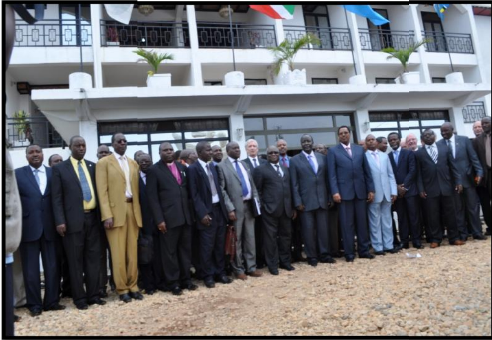
Photo de famille des participants à l'atelier de mai 2013 à Kayanza

Les principales innovations apportées par la Loi n° 1/20 du 3 juin 2014 portant révision de la Loi n° 1/22 du 18 septembre 2009 portant Code électoral et qui régit le processus électoral de 2015 sont les suivantes :